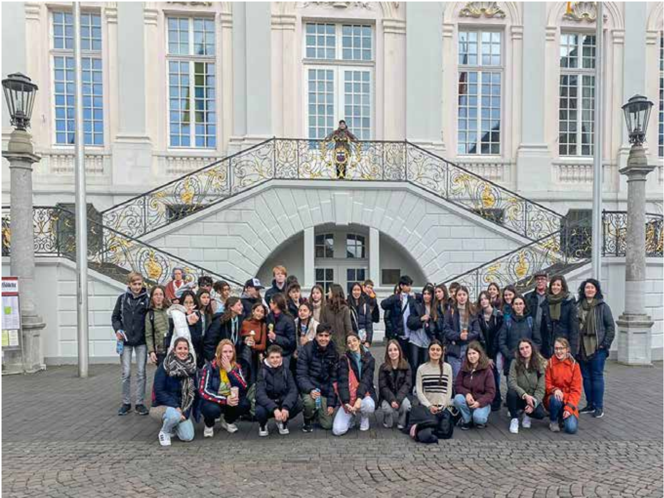
Ausflug mit den spanischen Gästen nach Bonn im März 2023