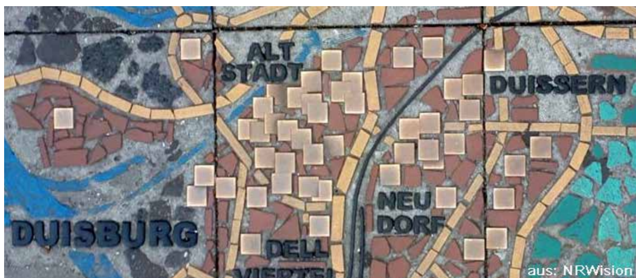
Stolpersteine im Bereich der Duisburger Innenstadt