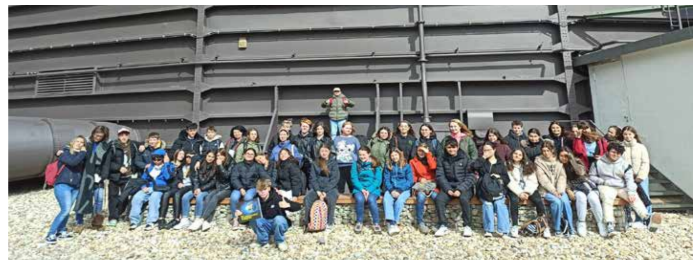
Spanische Gäste und deutsche Gastgeber vor dem Gasometer Oberhausen