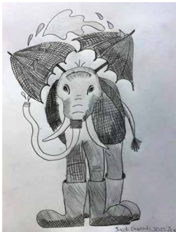
„Der Regefant“ - Zeichnung von Jacob Gurevits (6d) zum Thema: Verrückte Tiere

Die Wärter konnten mehrere interessante Geschichten über ihre Erlebnisse dort erzählen, wie z.B. dass Häftlinge die Zellen mit Edding komplett bemalt und verunstaltet haben oder einige die ganze Nacht durchsungen. Die Erfahrung und das hautnahe Erleben der Verhandlungen fügen nochmals wichtige Informationen und Wissen über den Beruf und die allgemeine Fachrichtung hinzu. Wenn auch ihr im nächsten Jahr in der neunten Klasse seid und an der