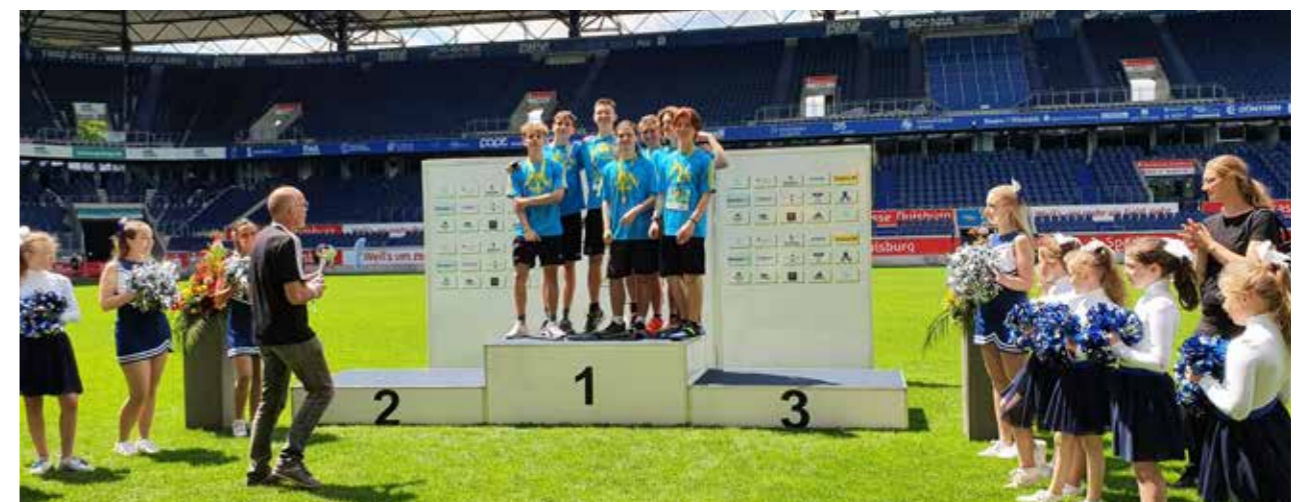
Siegerehrung für die Ekiden-Staffel des Landfermann-Gymnasiums beim 39. Rhein-Ruhr-Marathon am 12.06.2022. Nach 3:33:34 h hatte die Staffel als Erste das Ziel in der MSV-Arena erreicht.