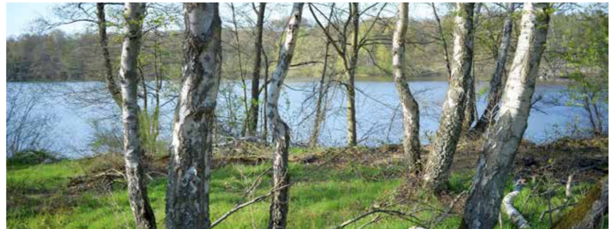
Am Entenfangsee (Mülheim)

Doch am Ende der Zeit, wenn alles zu seinem Schluss gekommen, denk daran, schau mich an und wisse: du hast gewonnen.