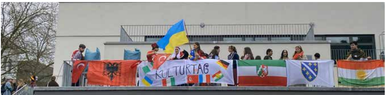
Letzter Schultag der Abiturientia 2023