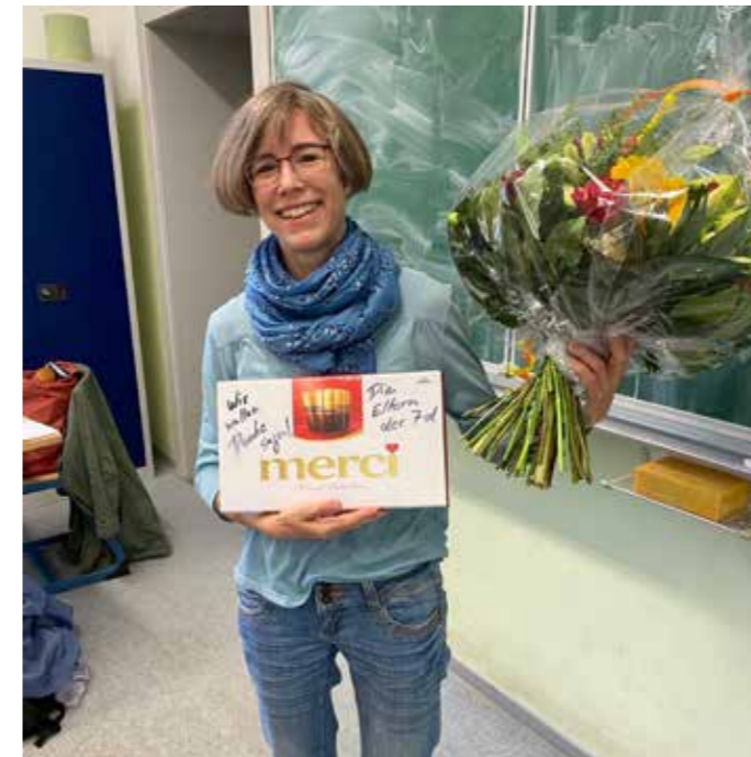
Dank und Anerkennung von ihrer Klasse 7d

Das Zeitalter der Digitalisierung hat die Schulen erreicht. Die Tafeln sind smart und die Schreibebretter multimedial geworden. Online ergänzt offline. Kommunikation 2.0: Dank dem Internet ist das Klassenzimmer immer auch connected, rückgekoppelt an den globalen Thinktank der digital herd und im ständigen Austausch mit co-workers, die am anderen Ende der Welt gerade einen Wikipedia-Eintrag aktualisieren oder einen zitierwürdigen Post bloggen – mit oder ohne trigger warning.