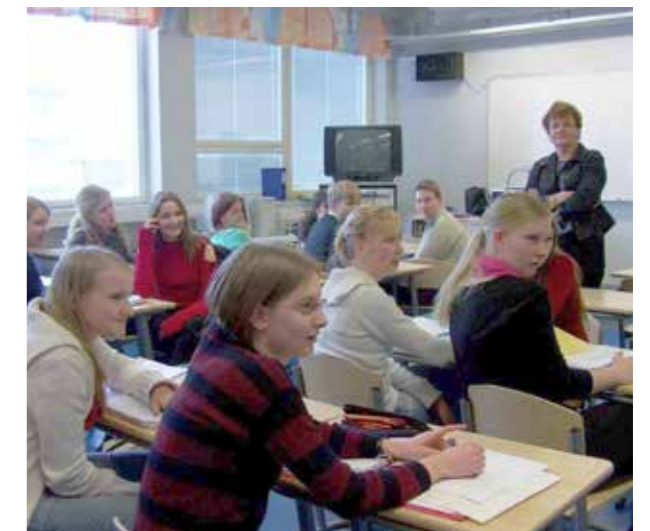
Unterricht im Mittelalter und heute Wie mag er wohl in Zukunft aussehen?