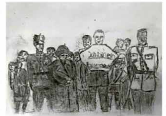
„Die anderen schauen nur zu.“

Im Laufe meiner Schulzeit bekomme ich immer mehr zu spüren, was es heißt, Jude zu sein. Meine Lehrer geben mir meist ungerechte Noten, und das nur wegen meiner jüdischen Abstammung. Auch wenn ich eigentlich Angst habe, etwas zu sagen, habe ich meinen Mut zusammengenommen und meinem Lehrer vor der ganzen Klasse widersprochen. Entgegen seiner antisemitischen Bemerkung habe ich kei-