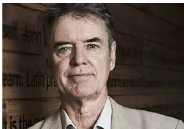
John Hattie (*1950), neuseeländischer Pädagoge

Wie schlecht es um die Bildung steht, das erkennt man schon daran, daß sie ihre Pflege zu einer behördlichen Angelegenheit gemacht haben. Über das Wissen wacht nun ein Ministerium. Warum werden keine Kanäle gegraben und keine Tunnel gebaut? Weil man stattdessen das Denken katalogisiert! Die Vermessung der Gedanken aus dem Geiste des Aktenschobers. Etwas Possierliches wird daraus entstehen! Daß es sich um eine hoffnungslose Burleske handelt, wird deutlich, wenn man gewärtigt, daß die Ministerien der Bildung gerne mit einem Frauenzimmer an der Spitze besetzt werden. Difficile est saturam non scribere! Demnächst ernennen sie noch einen Mönch zum Kriegsminister und Don Juan zum Chef der Sittenpolizei. Glauben Sie mir, das ist die wirkliche Statistik, die zählt.