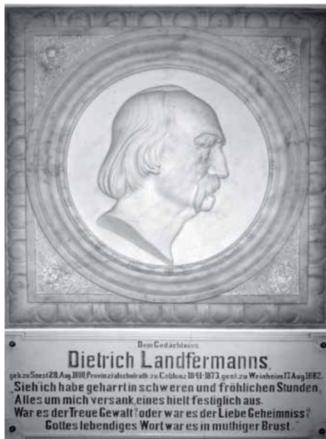
Gedenktafel im Treppenhaus des Neubaus des Landfermann-Gymnasiums

Nach seinem Abschied aus dem Staatsdienst (1873) lebte er in Weinheim an der Bergstraße (Baden-Württemberg), wo er am 17. August 1882 starb.