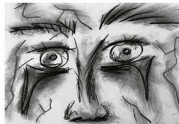
„Wir stehen in Abfällen.“

Ab 1953 ermöglichte das „Bundesentschädigungsgesetz“ den Opfern der nationalsozialistischen Verfolgung die Beantragung einer finanziellen Entschädigung für ihr Leiden und das ihrer Verwandten