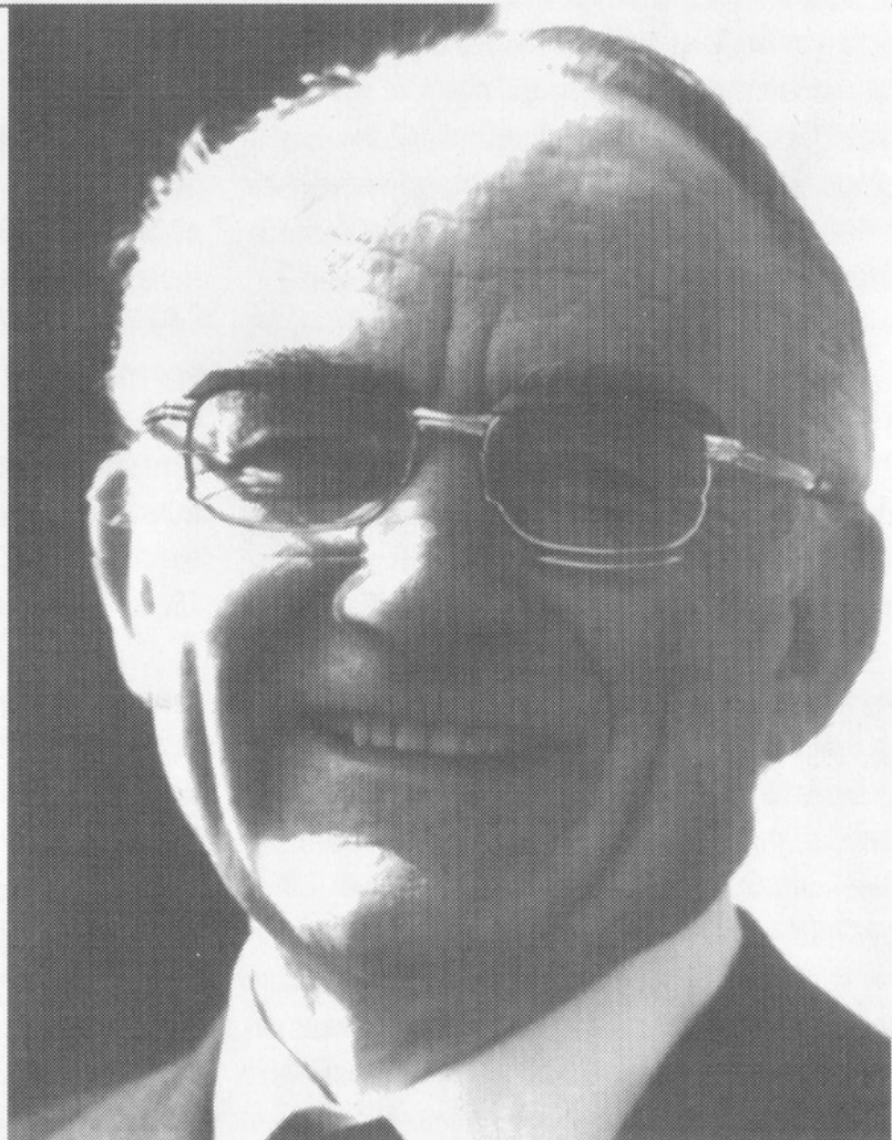
Prof. Dr. Erwin Iserloh

war Erwin Iserloh anlässlich der Ausstellung des heiligen Rockes 1959 gefordert. Er stellte sich auf den Standpunkt, daß die Echtheit der Reliquie nicht zu beweisen sei, sie aber für den Gläubigen durchaus eine symbolische Bedeutung habe.