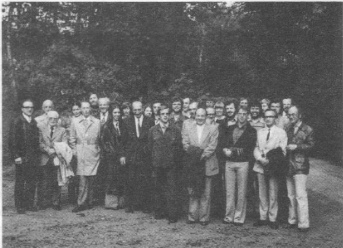
Das Lehrerkollegium des Landfermann - Gymnasiums im Juni 1977