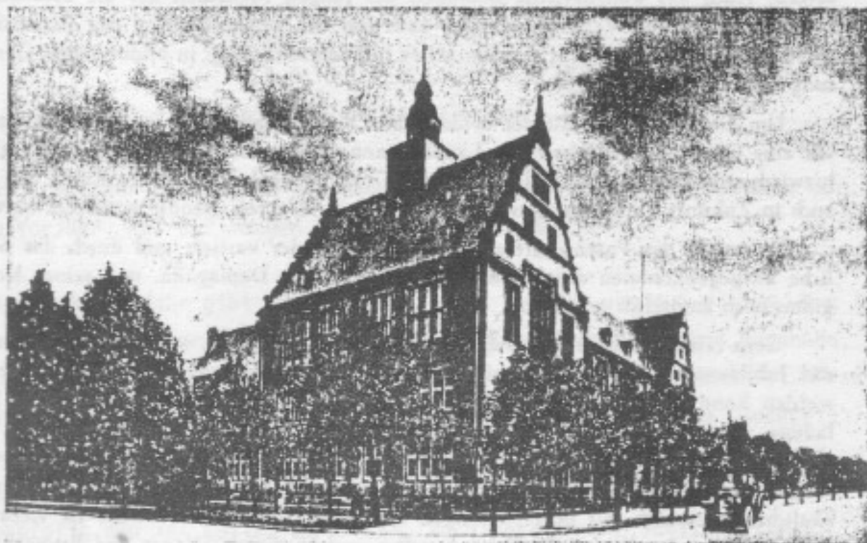
Das Landfermann-Gymnasium zu Duisburg

die berufliche Eingliederung zu bewerkstelligen. Auch das Landfermann-Gymnasium war von Bomben schwer getroffen worden, das Lehrerkollegium stark gelichtet.