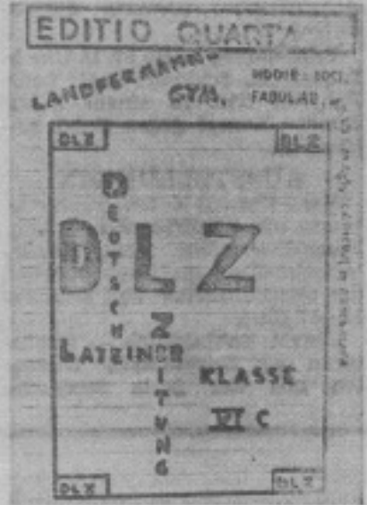
Die „Deutsche Lateiner-Zeitung“

In einem Gymnasium wird die erste Zeitung Deutschlands in Latein gedruckt. Die Redakteure: zwölfjährige Schüler