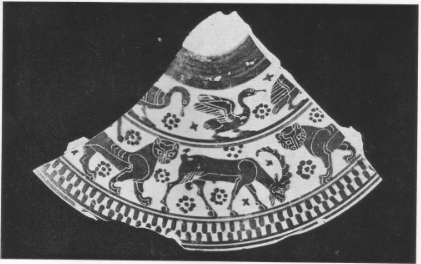
Fragment einer Pyxis. Korinth, Übergangsstil, um 625 v. Chr. Kleve, Privatbesitz.

im benachbarten Aigina ebenso zutage wie im fernen etruskischen Caere. Mit dem Dekor der Pyxischerbe verwandte Gefäße sind eine Oinochoe in Paris (Louvre) und eine Olpe (dickbäuchige Kanne) in Leningrad (Eremitage), beide zeigen den gleichen weidenden Steinbock; ferner mehrere Olpen in Rom (Vatikan), Gotha und Leipzig.