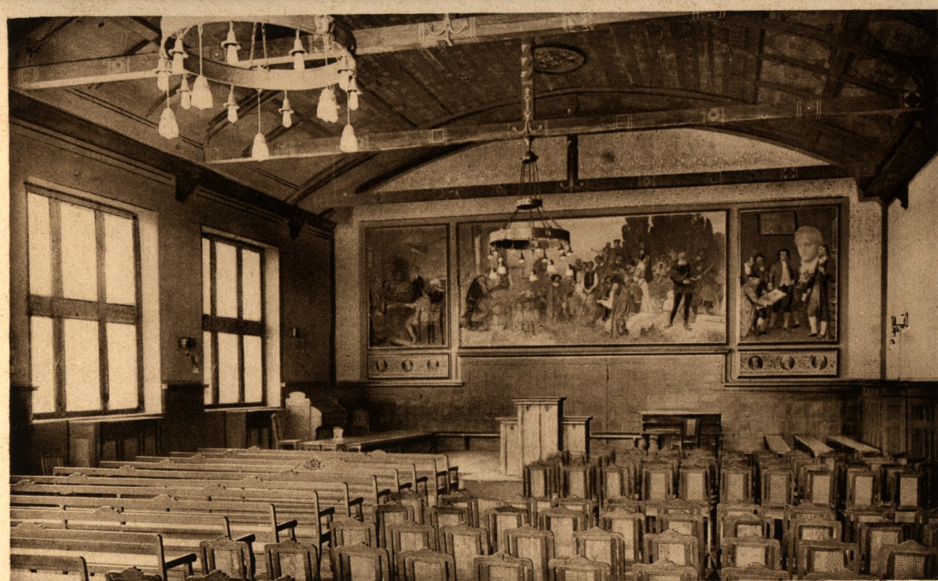
Duisburg. Landfermann-Gymnasium. Aula mit den Wandbildern v. Hans Krause.