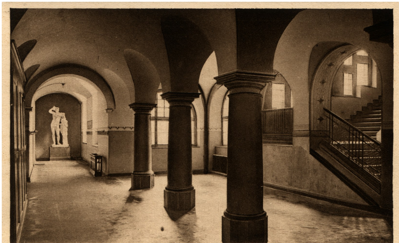
Duisburg. Landfermann-Gymnasium. Flur mit Hermes des Praxiteles.