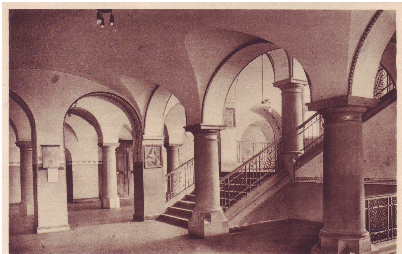
Duisburg. Landfermann-Gymnasium. Treppenhause.