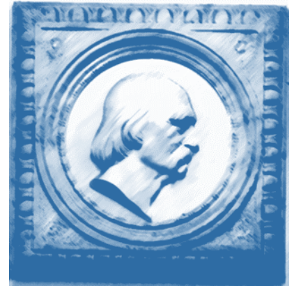
Mitteilungen der Schulleitung des Landfermann-Gymnasiums